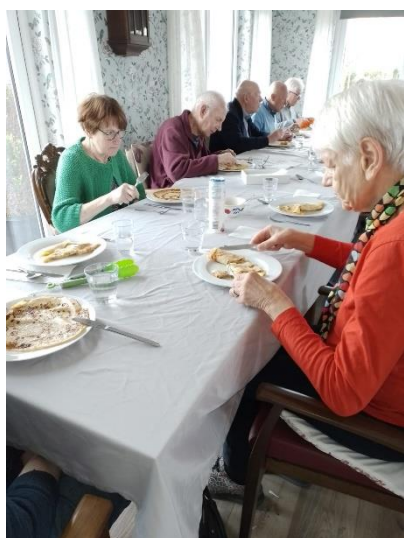
Heerlijke pannenkoeken mogen niet ontbreken. Wat is er lekker van gegeten.