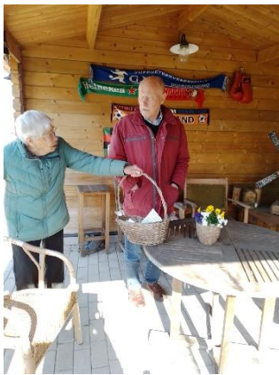
In het voorjaar is het weer tijd voor de paasdagen. Er is genoeg lekkers aanwezig, maar met name veel gezelligheid.