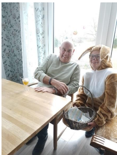
De paashaas kwam op bezoek en er zijn voorjaars stukjes met groen gemaakt.