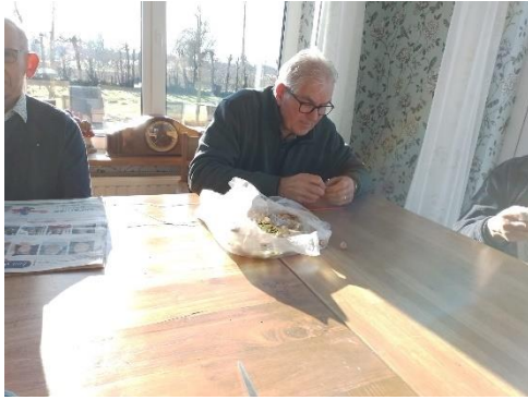
Ook voor de vogels rondom de Hofstede wordt gezorgd.